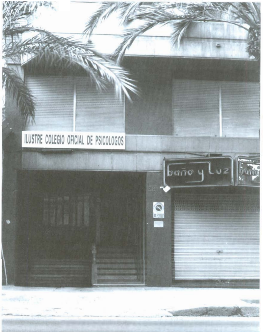
Fachada de la Sede en Alicante del COP-PV

Finalizado el proceso de cambio de sedes en Castellón y Alicante, y su mejora, sin perjuicio de que ésta sea un proceso permanente como demanda un profesión en expansión y un incremento notable en la actividad y los servicios colegiales, le llega la hora de su reforma a la tradicional sede de Valencia, tras su ampliación. Nuestros Es-