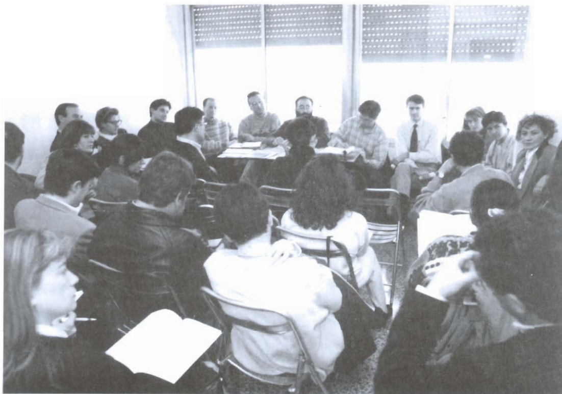
Sala de reuniones de la Sede en Castellón del COP-PV. Asistentes a la Junta General'93.

tatutos así también lo requieren, ya que en esta sede radica la Sección Territorial de Valencia y la de la Delegación del País Valenciano del Colegio Oficial de Psicólogos. Por ello, el volumen de gestión y actividad colegial en estos locales siempre ha tenido ese carácter doble. Todo ello ha conllevado la necesidad de adecuar las instalaciones a un conjunto de colegiados que no necesariamente han de residir en la demarcación territorial valentina.