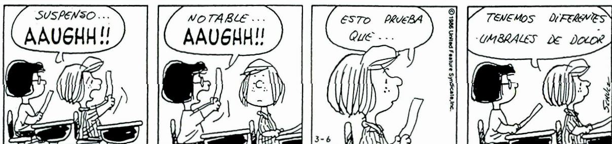
Figura 5: Viñeta cómica "Peanuts", de Charles Schulz, empleada para explicar el A-B-C de la terapia cognitiva (Clarke, Lewinsohn y Hops, 1990).

tas. Así, don Severo, maestro riguroso y autoritario, riñe y castiga a Guerrero, alumno hiperactivo y desinquieto, por no acabar los deberes de matemáticas. Pitagorín, empollón y pelota, "¡ya era hora que le pusieran las peras al cuarto!, ¡siempre incordiando!, ¡al fin le han dado su merecido, bien por el profe! ¡¡¡ja, ja, cómo me alegro!!!". Anarquía, feminista y ácrata, "¡no hay derecho!, ¡abusa de su autoridad!, ¡la Declaración Internacional de los Derechos del Niño, la Convención de Ginebra, la ONU...!, ¡es indignante, esta-